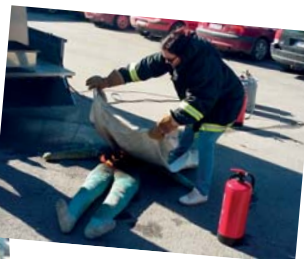
Alkusammutusharjoituksia toukokuussa 2017