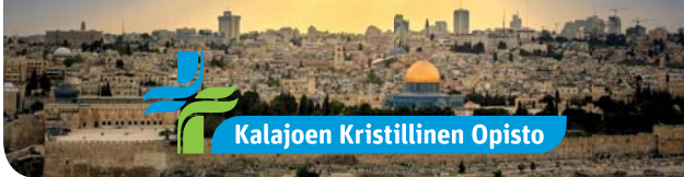
Kalajoen Kristillinen Opisto

Matkan tarkempi ohjelma nähtävissä www.kkro.fi ja www.jetretket.fi/valmismatkat